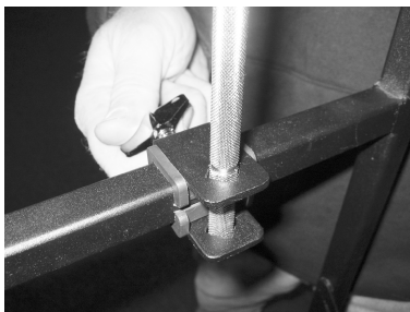
Nylon Clamp ナイロンクランプ